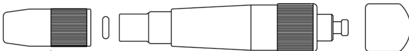
Diagrama esquemático del mango Ref.- 311431 (no desmontable):

Diagrama esquemático del mango Ref.- 311430: